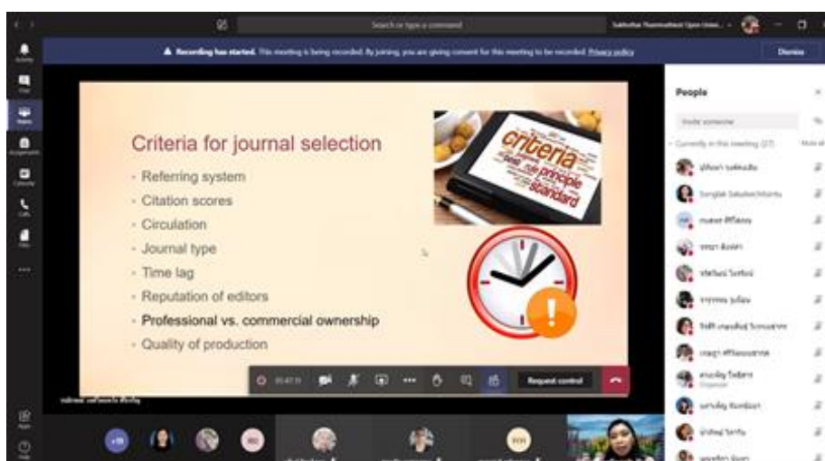
ภาพที่ 4 เกณฑ์การพิจารณาวารสาร

หลังจากนั้น วิทยากรได้กล่าวถึงเกณฑ์ในการพิจารณาวารสารที่จะลงบทความ ซึ่งมี 8 ข้อ ดังนี้