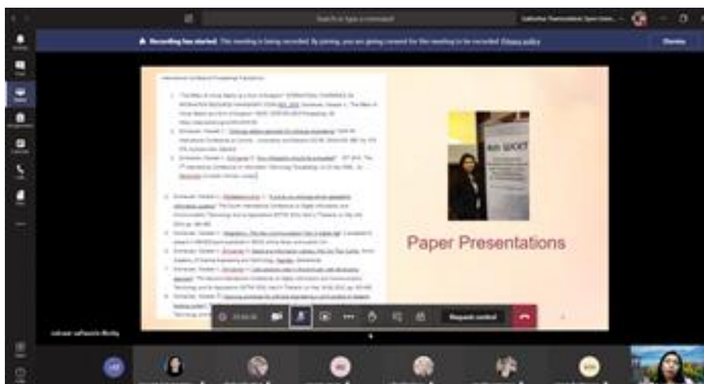
ภาพที่ 3 วิทยากรแบ่งปันประสบการณ์ในการนำเสนอผลงานทางวิชาการ

วิทยากรกล่าวว่า ผู้เขียนอาจเริ่มจากงานวิชาการที่สนใจในระดับเล็กก่อน โดยอาจผลิตออกมาในรูปแบบของบทความที่เสนอในที่ประชุมทางวิชาการ (proceeding) ก่อน หากตนเองเริ่มพัฒนาการเขียนงานทางวิชาการได้ดีขึ้นแล้ว ก็อาจเปลี่ยนมาเขียนบทความลงวารสารทางวิชาการได้อีกทางหนึ่ง นอกจากนี้วิทยากรยังได้แนะนำว่า บทความอาจเขียนขึ้นจากงานวิจัยของตนเองก็ได้